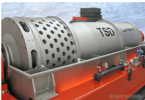
Zentrifuge TURBO SCREEN – eines der Produkte der Siebtechnik